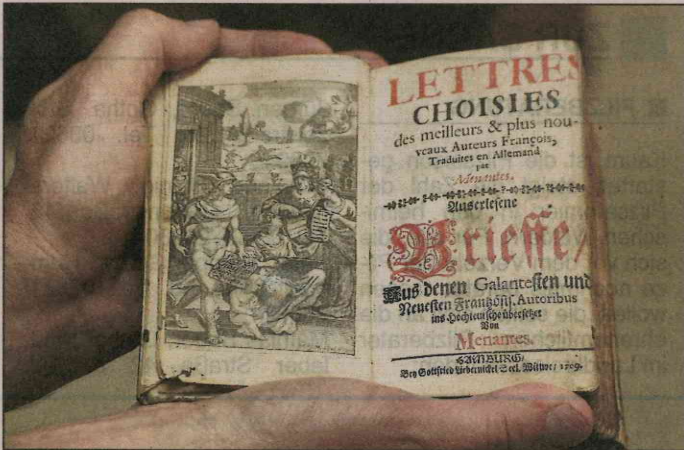
Ein Zeugnis, wie umfassend Menantes-Werke waren, hier auserlesene Briefe, französisch und deutsch verfasst.

funkaufnahme geben werde, sagt Pfarrer Kramer. Er sieht darin eine Wertschätzung des Bemühens der Wanderslebener, das Erbe von Menantes zu pflegen. Für sie ist der Fund ein neuerlicher Beleg, dass der große Sohn des Ortes