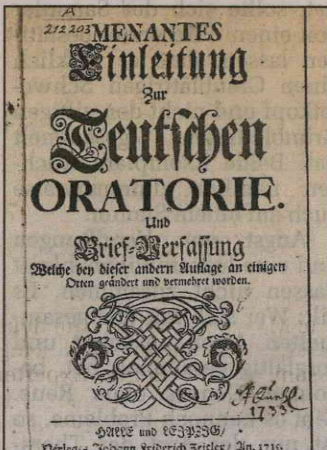
Anleitung für Oratorien-Texte von Menantes, von 1715.